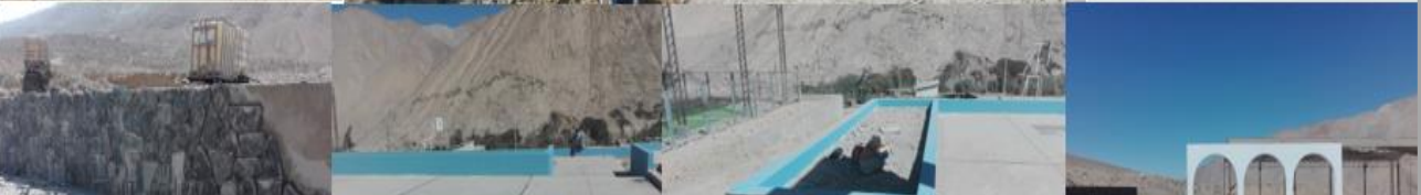
“CONSTRUION DE LA PLAZA DEL CENTRO POBLADO EL POZO, DISTRITO DE HUANUHUANO – CARAVELLI – AREQUIPA – I ETAPA”

TOCOTA – CARAVELI - AREQUIPA / 2018-2019