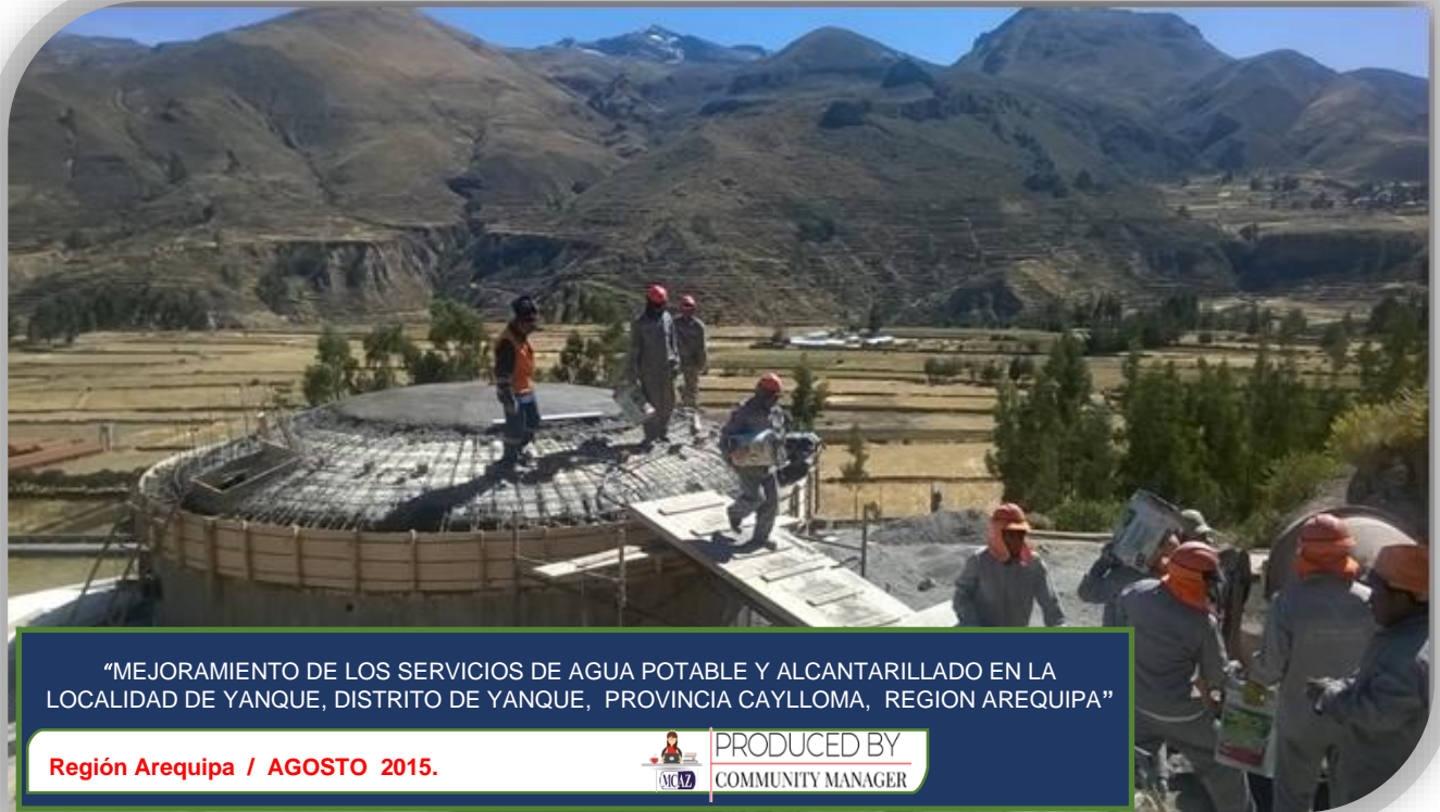
“MEJORAMIENTO DE LOS SERVICIOS DE AGUA POTABLE Y ALCANTARILLADO EN LA LOCALIDAD DE YANQUE, DISTRITO DE YANQUE, PROVINCIA CAYLLOMA, REGION AREQUIPA”