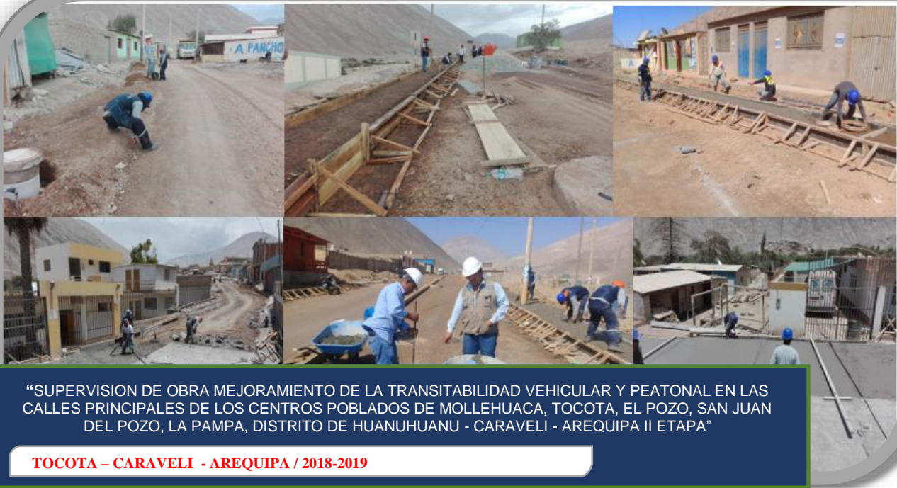
“SUPERVISION DE OBRA MEJORAMIENTO DE LA TRANSITABILIDAD VEHICULAR Y PEATONAL EN LAS CALLES PRINCIPALES DE LOS CENTROS POBLADOS DE MOLLEHUACA, TOCOTA, EL POZO, SAN JUAN DEL POZO, LA PAMPA, DISTRITO DE HUANUHUANU - CARAVELI - AREQUIPA II ETAPA”

TOCOTA – CARAVELI - AREQUIPA / 2018-2019