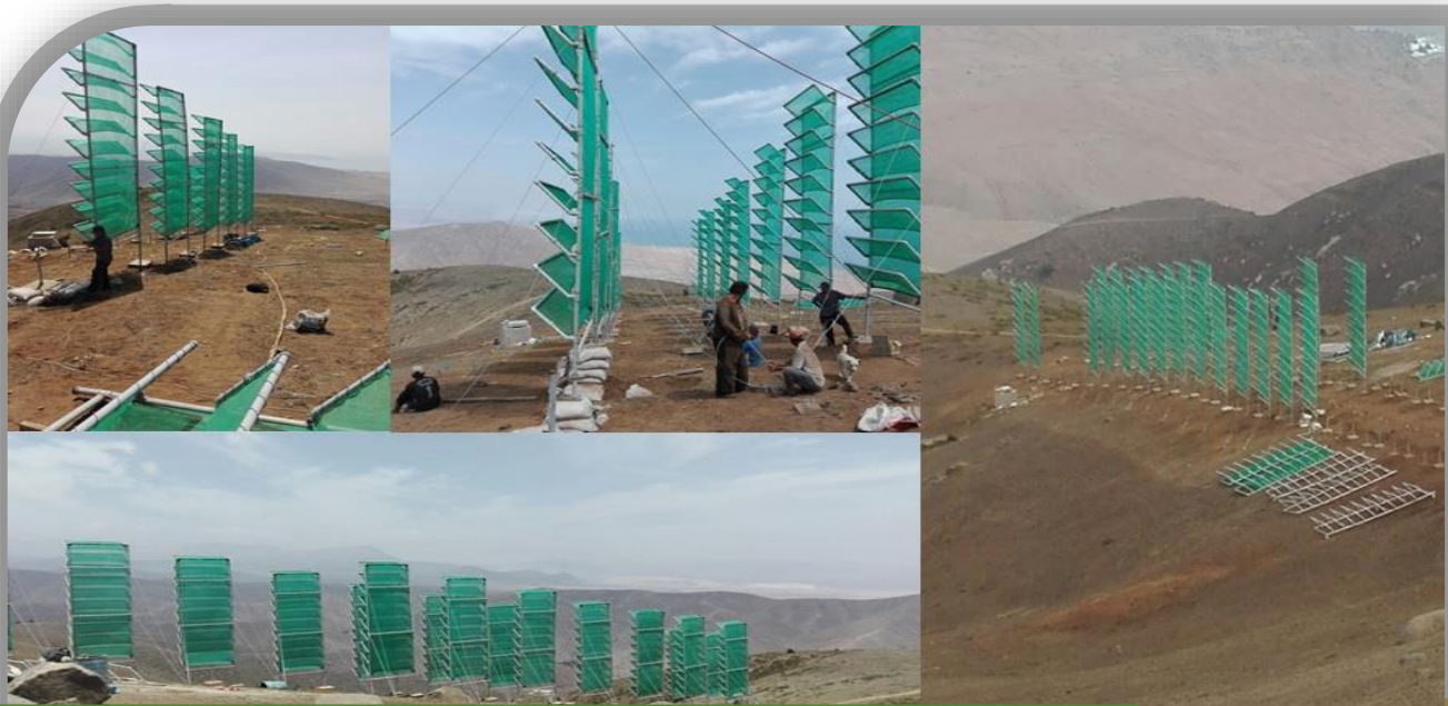
“MEJORAMIENTO DEL SERVICIO DE AGUA PARA RIEGO DEL SECTOR DE ATQUIPA, DISTRITO DE ATQUIPA, PROV. CARAVELI - AREQUIPA”

Consorcio ACUARIO/ATQUIPA, CARAVELÍ-AREQUIPA