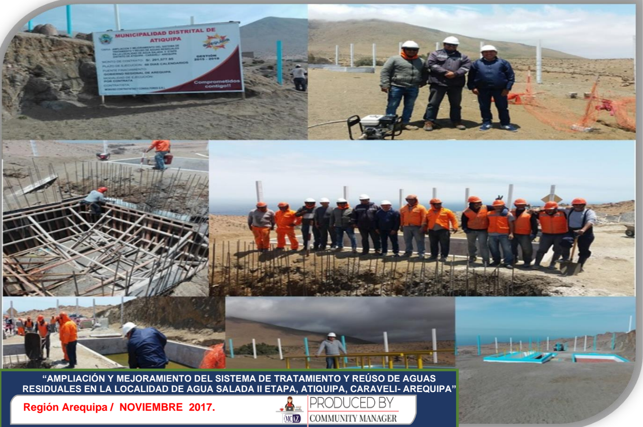
“AMPLIACIÓN Y MEJORAMIENTO DEL SISTEMA DE TRATAMIENTO Y REÚSO DE AGUAS RESIDUALES EN LA LOCALIDAD DE AGUA SALADA II ETAPA, ATQUIPA, CARAVELI- AREQUIPA”