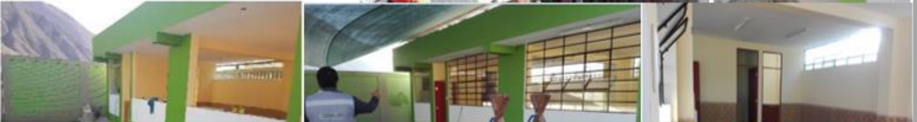
“MEJORAMIENTO DEL SERVICIO Y LA CAPACIDAD EDUCATIVA DE LA I.E.I. NIÑO JESUS DE PRAGA, TOCOTA, DISTRITO DE HUANUHUANO, PROVINCIA DE CARAVELI, AREQUIPA”

TOCOTA – CARAVELI - AREQUIPA / 2018-2019