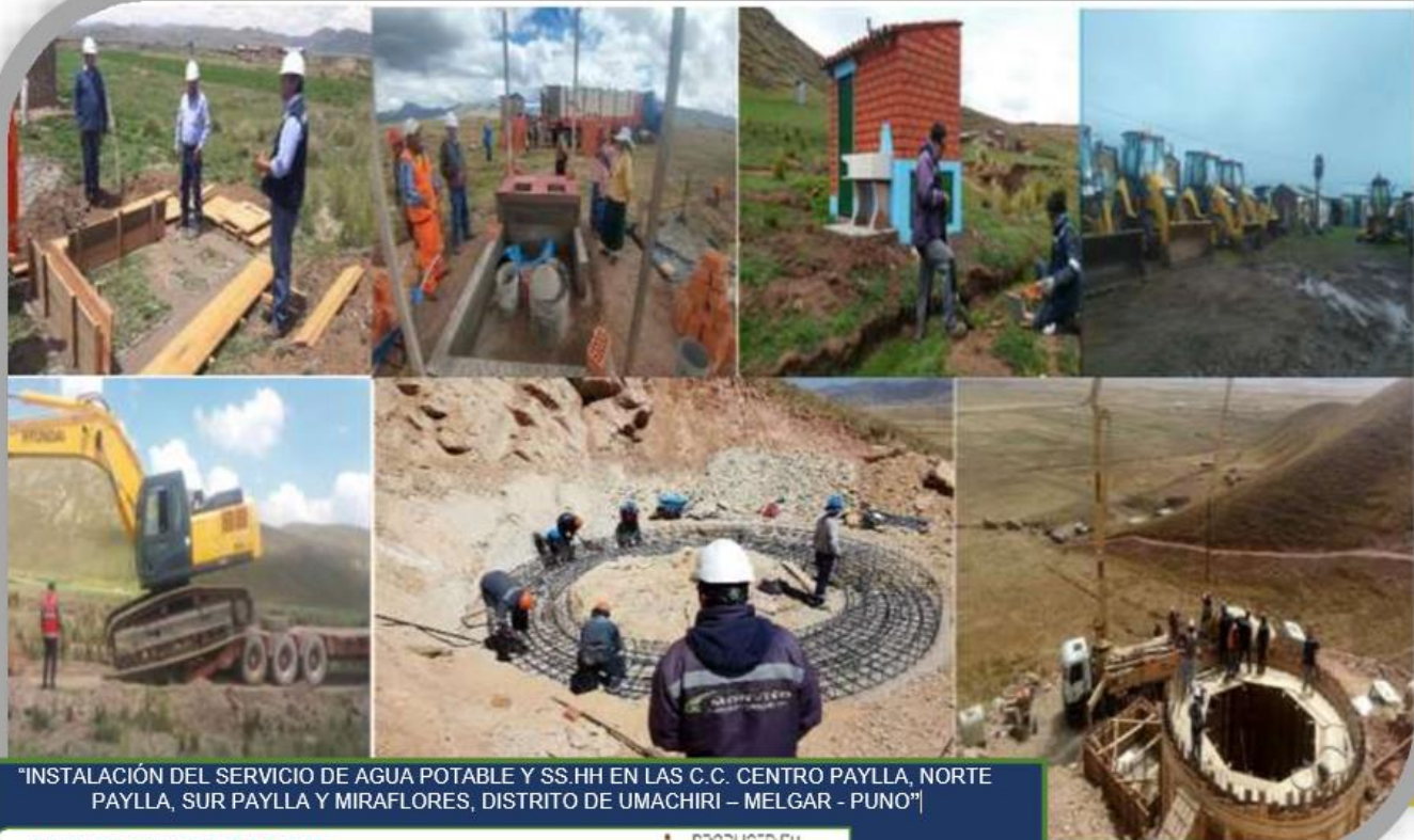
“INSTALACIÓN DEL SERVICIO DE AGUA POTABLE Y SS.HH EN LAS C.C. CENTRO PAYLLA, NORTE PAYLLA, SUR PAYLLA Y MIRAFLORES, DISTRITO DE UMACHIRI – MELGAR - PUNO”