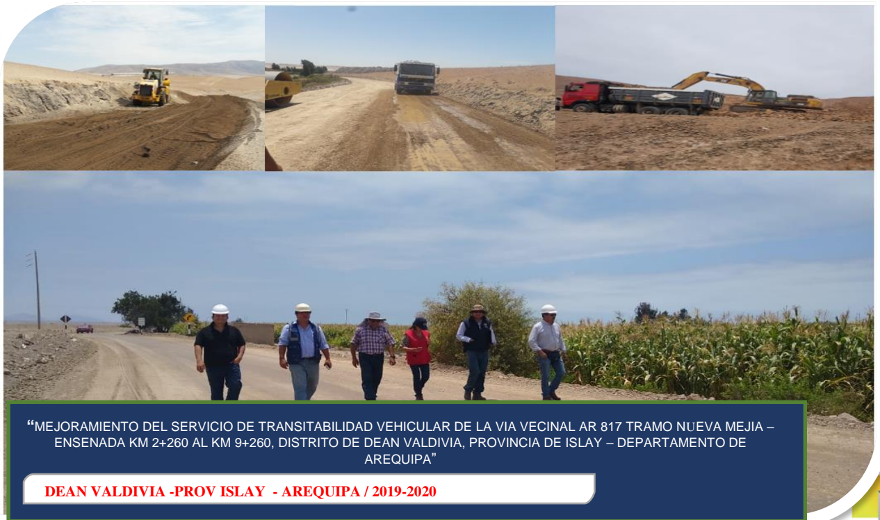
“MEJORAMIENTO DEL SERVICIO DE TRANSITABILIDAD VEHICULAR DE LA VIA VECINAL AR 817 TRAMO NUEVA MEJIA – ENSENADA KM 2+260 AL KM 9+260, DISTRITO DE DEAN VALDIVIA, PROVINCIA DE ISLAY – DEPARTAMENTO DE AREQUIPA”

TOCOTA – CARAVELI - AREQUIPA / 2018-2019